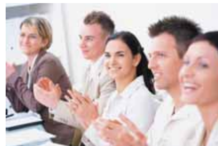
Abb. 2:

EVFK - Europäischer Verband für Kinesiologie e.V. Cunostr. 50 - 52 D-60388 Frankfurt-Bergen E-Mail: info@evfk.de www.kinesiologie-verband.de