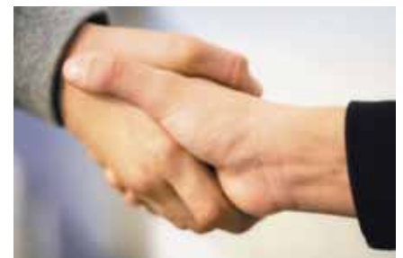
Abb. 3:

Voraussetzung für eine gelungene Interaktion zwischen Anwender und Klient ist, dass die Methode eine positive Wirkung erzeugt und zur Weitervermittlung geeignet ist. Der Anwender muss durch eine Ausbildung seiner beruflichen Kompetenz legitimiert sein. Der Klient muss mit seinem Anliegen zu dem Angebot passen. Sind diese drei Faktoren gegeben, ist mit einer gelungenen Interaktion zu rechnen.