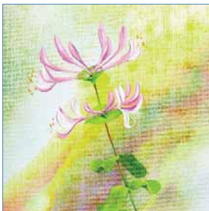
Abb. 1: Bach-Blüte Honeysuckle, (c) Erika und Hermann Haindl

In der Zwischenzeit hatten zwei Familienfeiern stattgefunden, und sie hatte Kontakt zu ihrer Ursprungsfamilie gehabt. Dabei hatte sie das Gefühl, nicht verstanden zu werden und hatte erkannt, dass Schreien keine Lösung ist. Die Emotionale Kinesiologie führte diesen Konflikt in das Alter von drei Jahren zurück. „Hör endlich auf zu schreien!“ war ihr noch aus ihrer Kindheit im Ohr. Die Erkenntnis um diesen Zusammenhang führte zum Zielsatz: „Ich habe Verständnis für meine Mutter.“ Unter diesem Aspekt sah sie das Schreien der Tochter und ihre Hilflosigkeit in einem neuen Licht.